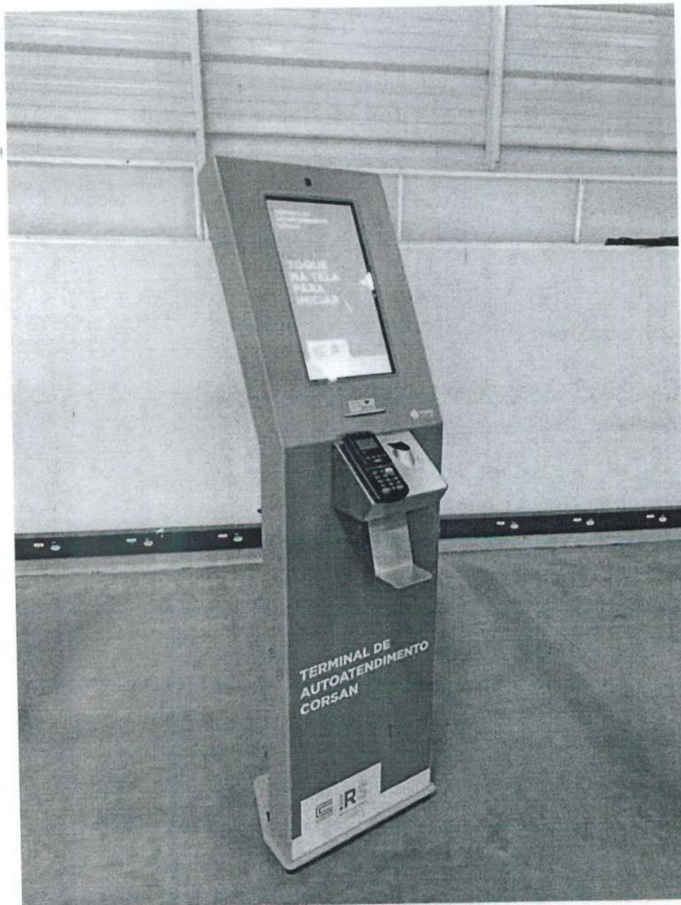
Foto do terminal de autoatendimento

COMPANHIA RIOGRANDENSE DE SANEAMENTO DIRETORIA COMERCIAL, INOVAÇÃO E RELACIONAMENTO DEPARTAMENTO DE GESTÃO DOS CANAIS DE RELACIONAMENTO